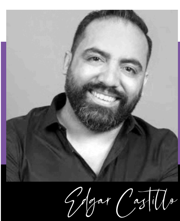
Director de Casting

Te acompañarán, aconsejarán y guiarán dos personas llenas de experiencia y que se encargarán de tu evolución :